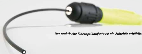
Der praktische Faseroptikaufsatz ist als Zubehör erhältlich.