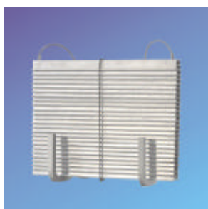
FL RL-5 oder FL RL-8