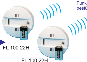
FL 100 22H

Jeder FL 100 22H ist mit einem Funksendemodul FL FS 100 bestückt.