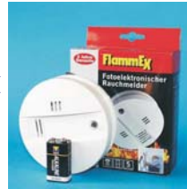
FL 100 22H

Einfache Installation des Gerätes an der Decke