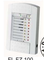
FL FZ 100